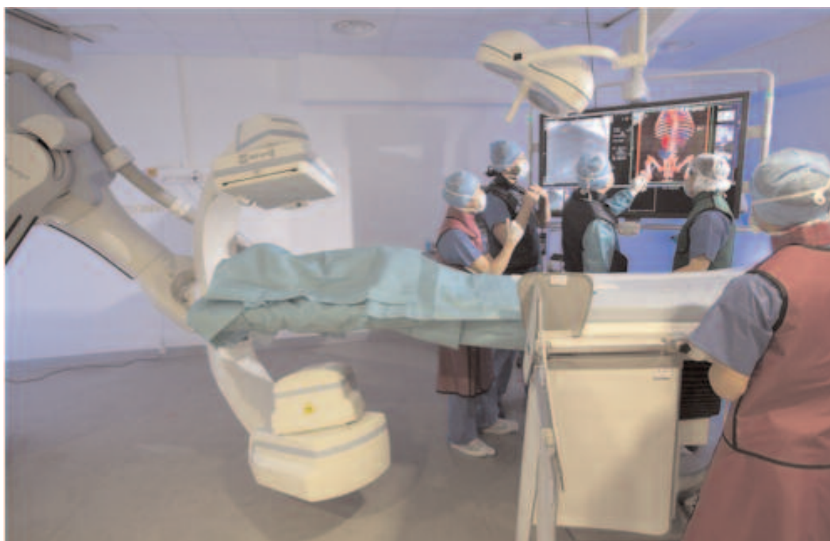
Chirurgie non invasive (Strasbourg)

Les ressources nécessaires, publiques et bancaires, ont été sécurisées pour un investissement annuel de 4,5Md€ spécifiquement dédié à la modernisation des hôpitaux sur nos territoires.